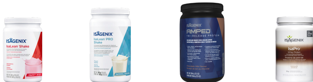
Tableau comparatif des boissons frappées Isagenix